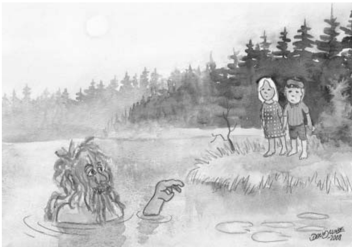
Om barnen gick ensamma till sjön kunde de råka ut för "Å-gubben"