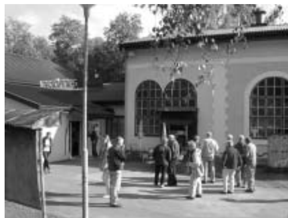
Utanför Lesjöfors museum

Bussen avgick från Hallstahammar tidigt på morgonen och var nästan fullsatt med deltagare från Skantzen och Trångfors. Några ytterligare passagerare steg på i kommunerna norrut längs vägen över Fagersta, Ludvika och genom Finnmarken till Lesjöfors.