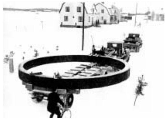
Rotorringen passerar Hallstahammar. Fotot taget från taket på sportaffären.

Denna artikel var publicerad i Tunga Magasinet nr 3 2003. Den baserades till stor del på material ur dagstidningar, samt en del material i Aseas arkiv, och även på egna anteckningar om fordon som var aktuella i sammanhanget. Efter att artikeln gått i tryck och Tunga Magasinet även hunnit läggas ner, kom mer material fram som borde ha funnits med. Det kommer här, och behandlar delvis tiden "före och efter". Redan när sådana här maskiner fortfarande bara fanns på ritbordet, måste man ta med i beräkningarna om och hur pjäserna skulle kunna transporteras från tillverkning till montering. Beträffande rotorringarna till kraftverket i Imatra, började problemen redan vid gjuteriet i Surahammar, hur skulle de fraktas till Aseas verkstäder i Västerås. I princip fanns ju sjöväg, (Strömsholms Kanal), ända från industriområdet i Surahammar nästan fram till Aseaområdet vid nuvarande Kungsängsgatan i Västerås. Dessutom fanns alternativen järnvägstransport eller landsvägstransport.