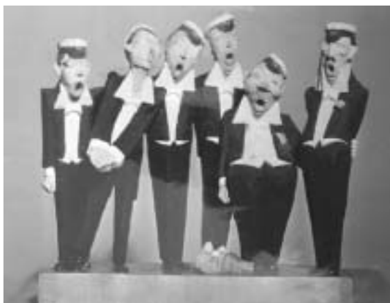
”Sångarbröder” –Carls kanske mest uppskattade verk i Amerika.

Hösten 1975 rånas han brutalt av ett gäng, men kämpar emot trots att han är över 80 år. Han får en bruten arm, blir blind på ett öga och ”stendöv” på ena örat.