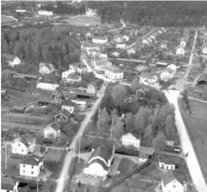
Flygfoto från 30-talet. Godtemplarlokalen – ”Luckan” – är det stora vita huset i mitten nedtill, ungefär där Sagabiografens parkering ligger idag.