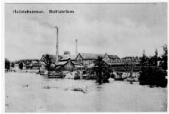
Ett vykort från Hallstahammar vid ungefär samma tid.

Det torde kanske intressera den stora allmänheten att höra något om förhållanden vid Hallstahammar med omnejd. Jag vill först börja med bruket, som har ström och kanal på västra, samt järnvägen Ramnäs – Kolbäck på den östra sidan. Där finnes martin- samt valsverk och sysselsätter omkring ett hundra arbetare, hvilka alla äro utan undantag otroligt lågt aflönade, timpenningen varierar mellan 13 à 18 öre. Det stora flertalet tillhör ej någon organisation, hvadan något så när dräglig existens är svårt att åstadkomma så framt ej arbetarna rycka upp sig och fordra ersättning för de arbeten de utföra. Därför sluten och enen eder till organisationen!